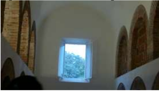
Figura 2. Exhacienda de Noguerras