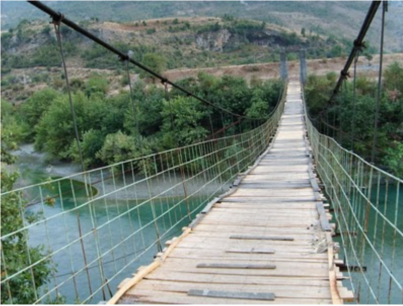
Jadukata Bridge (Ranikor, India)