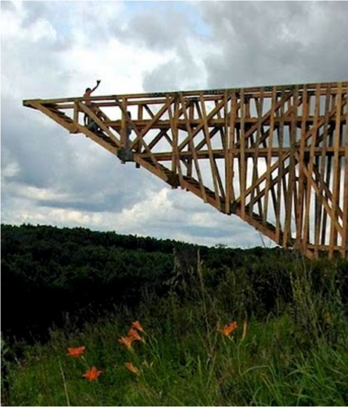
Humber Bridge (Kingston upon Hull, England)