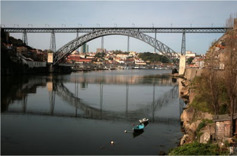
Ponte Vecchio (Florence, Italy)