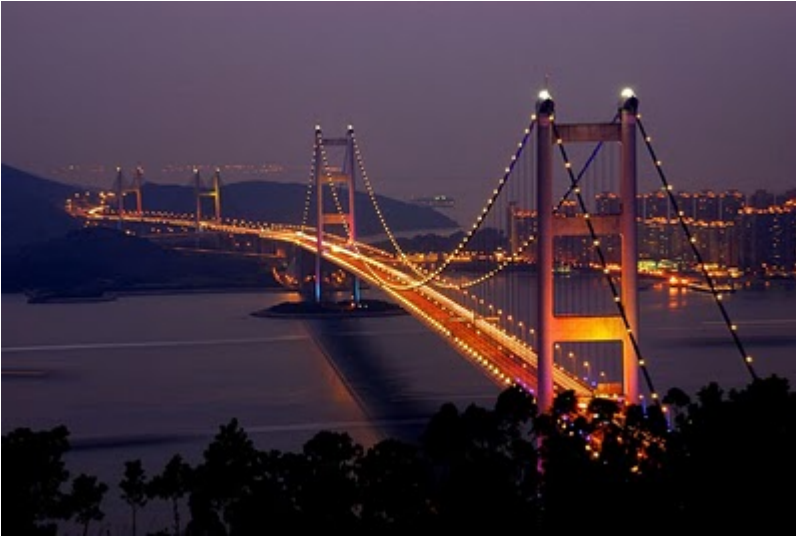
Vasco da Gama Bridge (Lisbon, Portugal)