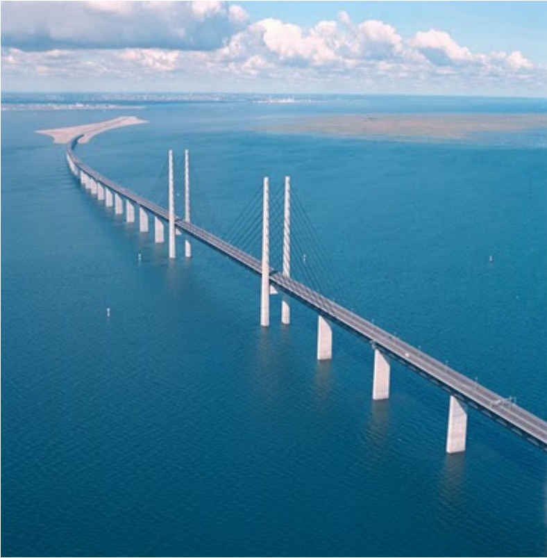
Pont du Gard (Vers-Pont-du-Gard, France)