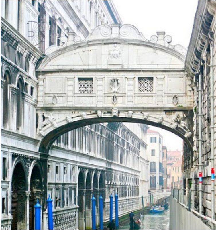
Brooklyn Bridge (Brooklyn, New York, USA)