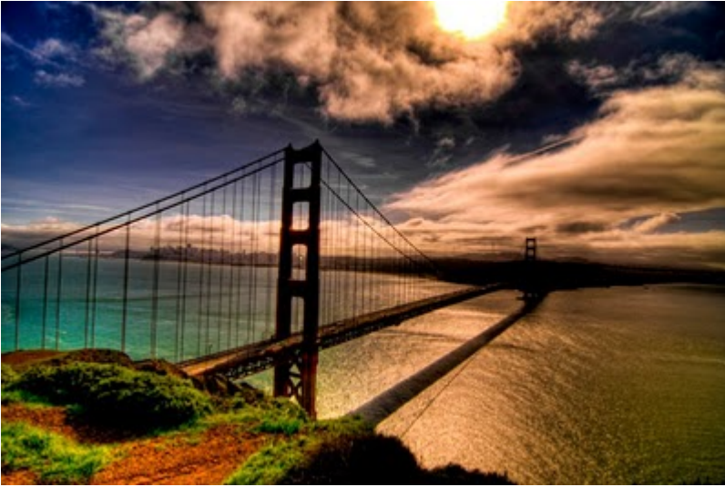
Forth Railway Bridge (Fife, Scotland)