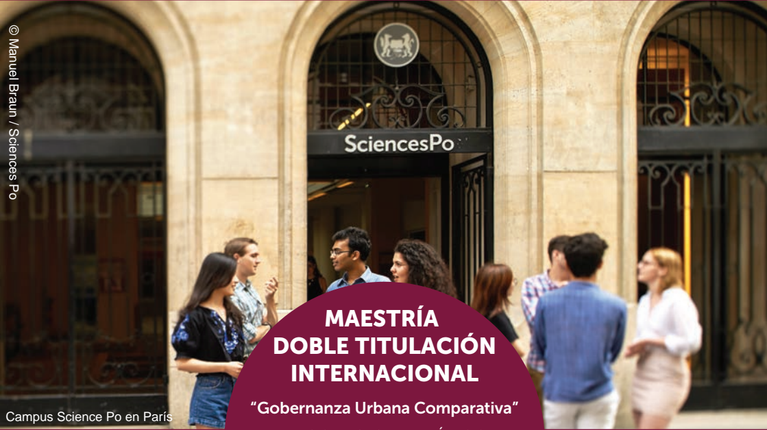
Campus Science Po en París