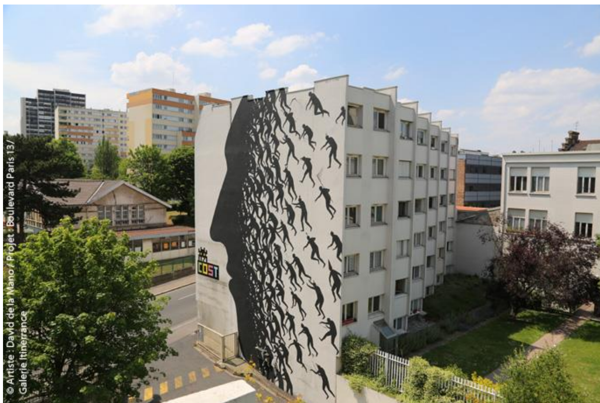
© Artiste : David de la Mano / Projet : Boulevard Paris 13 / Galerie Itinérance