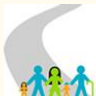
La Ruta del Censo 2022

► CHILDFUND: Consultoría de "Taller de reflexión sobre protección de la infancia a nivel comunitario"