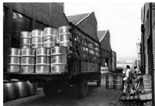
Fábrica de tambores da Pompéia. Veja artigo de Marcelo Carvalho Ferraz em Minha Cidade