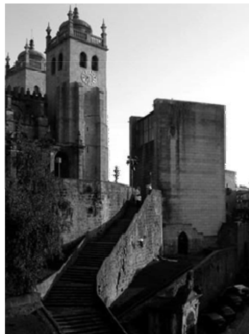
Sé do Porto e Casa dos 24, 2007. Leia artigo de Francisco Portugal e Gomes em Arqtextos

Bula de Intenções N°1 Intervenção urbana do grupo "Pparalelo de Arte Contemporânea"