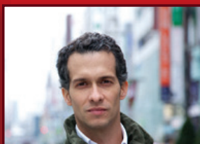
Camilo Restrepo Ochoa AGENDa - Agencia de Arquitectura