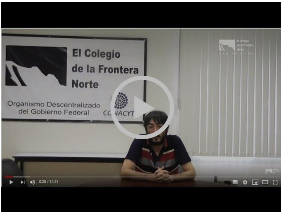
Reflexión comparativa entre el atentado de El Paso, Texas (2019) y Oslo, Noruega (2011)