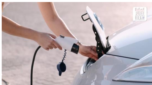
Infraestructura Verde ¿Cómo beneficia a las urbes?