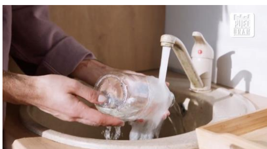
El agua en las ciudades ¿el agua se acaba?