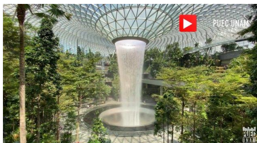
Ecotecnologías: su uso en las urbes