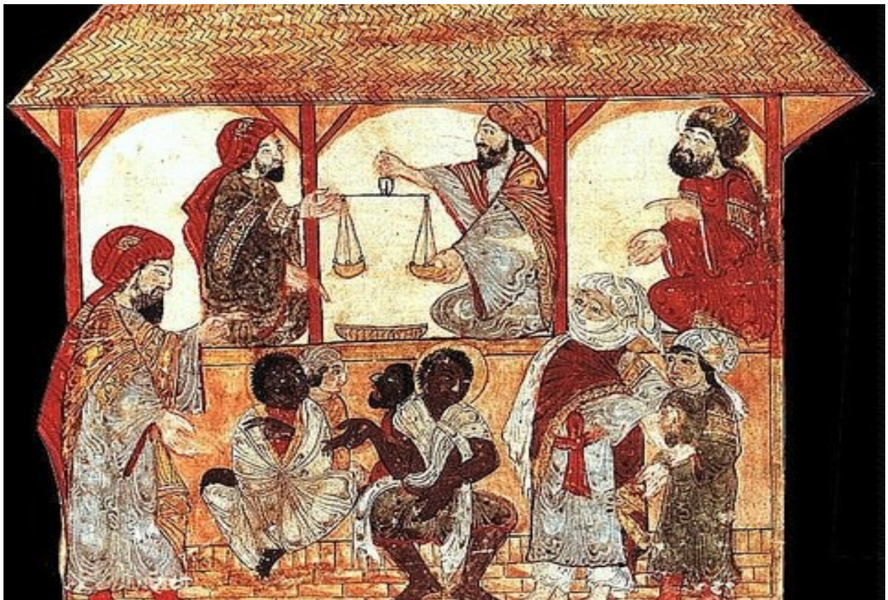
Mercado de esclavos en Yemen, miniatura del siglo XIII.