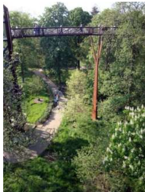
Kew Gardens, Xstrata Walkway Treetop, Londres. Leia o artigo de Francine Sakata em Arquiteturismo

Orquestra Sons Recicláveis Instituto Musical Beethoven