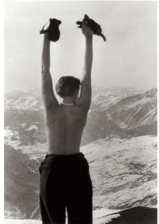
Imagem presente no Cartaz da exposição de Charlotte Perriand em Paris. Leia o artigo de Silvia Palazzi Zakia em Arquitetura

Noticiário geral Veja todas as notícias disponibilizadas em Vitruvius