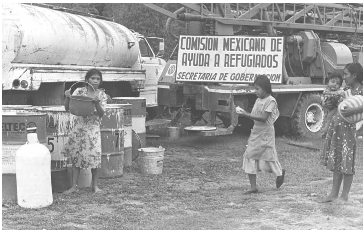
Reubicación, Campeche, 1984 ♦ Archivo de la Comisión Mexicana de Ayuda a Refugiados.

Chiapas, y a través de la reubicación a Campeche y Quintana Roo mediante la repatriación y el retorno a Guatemala, sino en fechas anteriores, con la colonización de la selva y la experiencia cooperativa. Además, lo fue en momentos posteriores con la migración a Estados Unidos y al sureste mexicano.