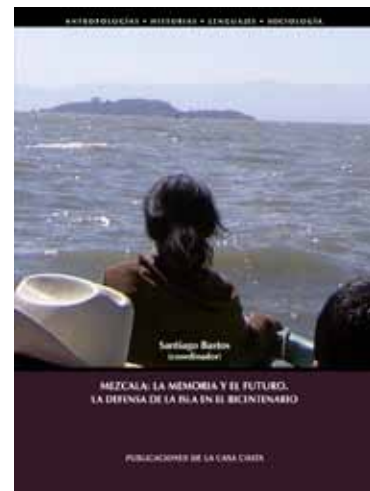
CIESAS, México 2012 ISBN 978-607-486-173-0

Este libro recoge distintas voces que muestran cómo el hecho histórico de la defensa de la isla de Mezcala es recordado y resignificado en el contexto de la lucha actual de la Comunidad Indígena de Mezcala en la defensa de su territorio y su identidad. Contiene trabajos de investigadores relacionados con el proceso que se vive en esta comunidad, comunicados presentados por la Comunidad Indígena estos años y textos escritos por los mismos comuneros y comuneras de Mezcala.