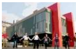
O VÃO LIVRE DO MASP MERECE UM ABRÇO DE SÃO PAULO!

Sábado, dia 7 de dezembro, às 11h, é dia e hora de dar um abraço coletivo no MASP! Grupo O vão livre do Masp merece um abraço de São Paulo convoca população a se manifestar pela manutenção do espaço público. Apoio pode ser dado também via facebook