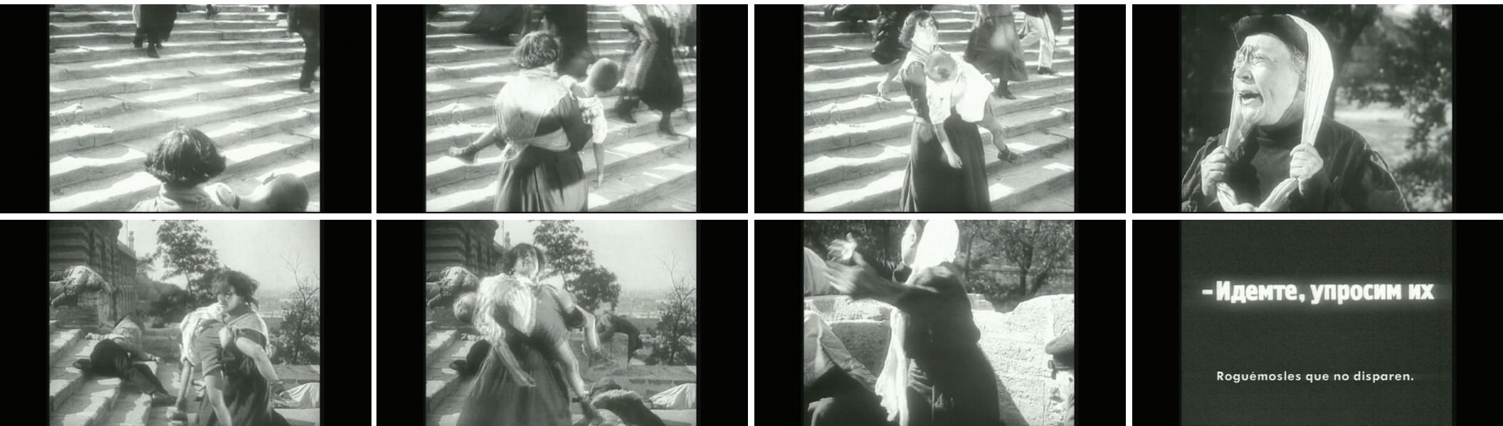
Fotogramas de El Acorazado Potemkin (Eisenstein, 1925)