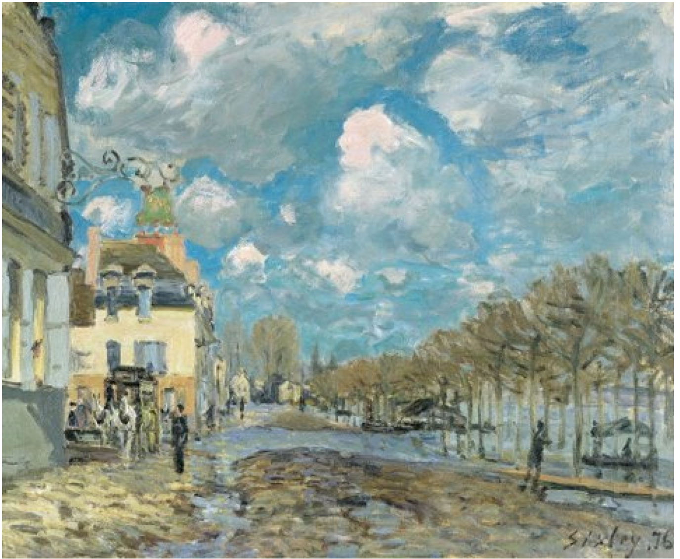
Alfred Sisley: " La inundación en Port Marly ", 1876.