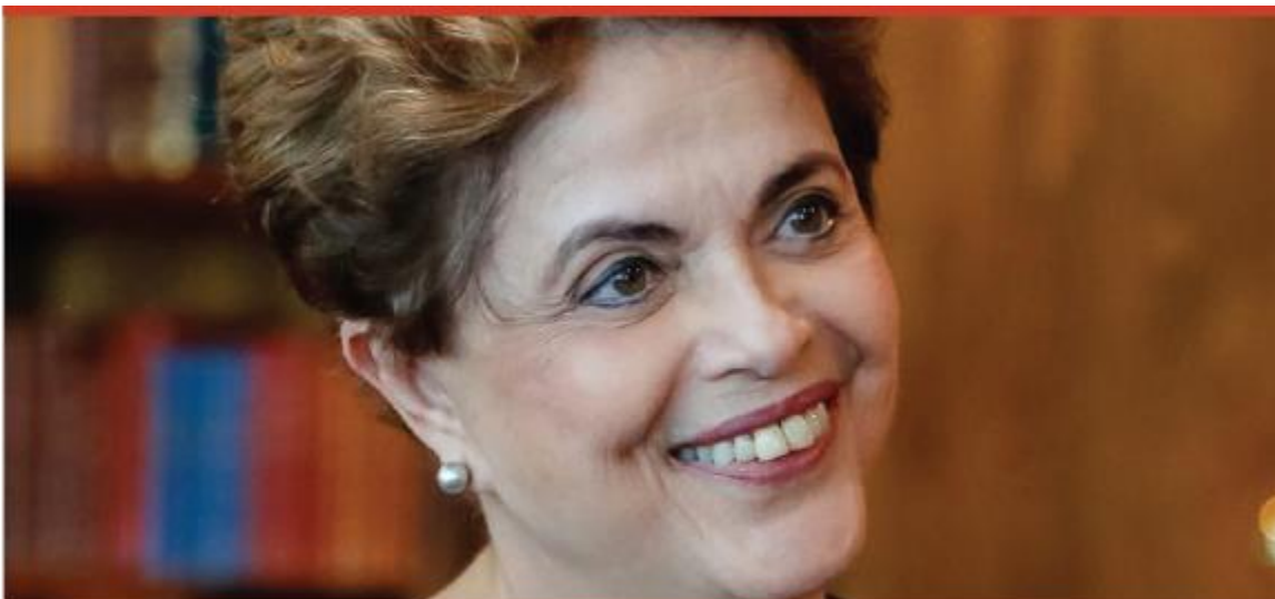
DILMA ROUSSEFF [Ex Presidenta de Brasil]

La especialización y el curso internacional buscan aportar herramientas de análisis, investigación e intervención institucional en diversos campos de las políticas públicas contribuyendo a la promoción de estrategias de inclusión, a la afirmación de los derechos humanos y al fortalecimiento de la ciudadanía. La especialización y el curso internacional abordarán los desafíos de la actual coyuntura política para la promoción de la igualdad y la justicia social en América Latina desde el campo de análisis de las políticas sociales, económicas, educativas y culturales; tratarán la complejidad de los procesos de producción de las desigualdades proponiendo enfoques basados en las perspectivas de género, la discriminación racial, la violencia y la seguridad ciudadana, los procesos de integración regional, la situación de la infancia y la juventud, así como de la justicia y la promoción de una ética pública.