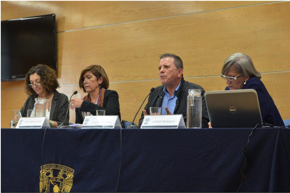
Se llevó a cabo el II Coloquio Internacional Ciudad, Espacios públicos en conflicto. Género, juventudes y ciudadanías