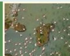
XIX edición Premios Fundación BBVA a la Conservación de la Biodiversidad