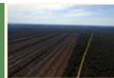
Los desafíos ambientales de Bolivia en 2023