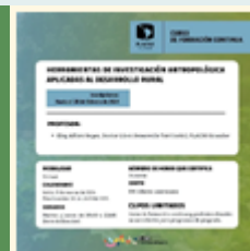
Herramientas de investigación antropológica aplicadas al desarrollo rural