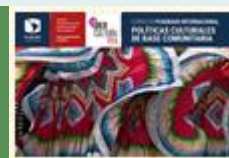
Posgrado Políticas Culturales de Base Comunitaria 2024