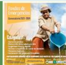
Plataforma Boliviana Frente al Cambio Climático - Fondos de Emergencia