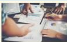
Servicios de CEBEM

Te invitamos a que puedas transmitir a través de nuestros boletines.