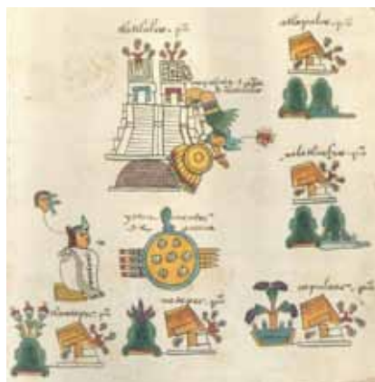
Fragmento del Códice Mendoza, 1541-1542, Tlatelolco ♦

El mismo Fray Bernardino de Sahagún escribió cómo se vendían en el tianguis panes de color grana, los cuales eran comprados por los pintores y tintoreros. Señala igualmente cómo este color en polvo se mezclaba con ciertos entonadores para obtener matices anaranjados, amarillos, violetas y rojos (Sahagún; F.B. TIII: 151).