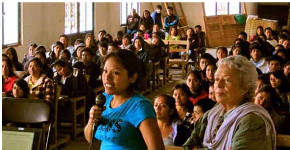
Asistentes a la conferencia inaugural dirigida a estudiantes