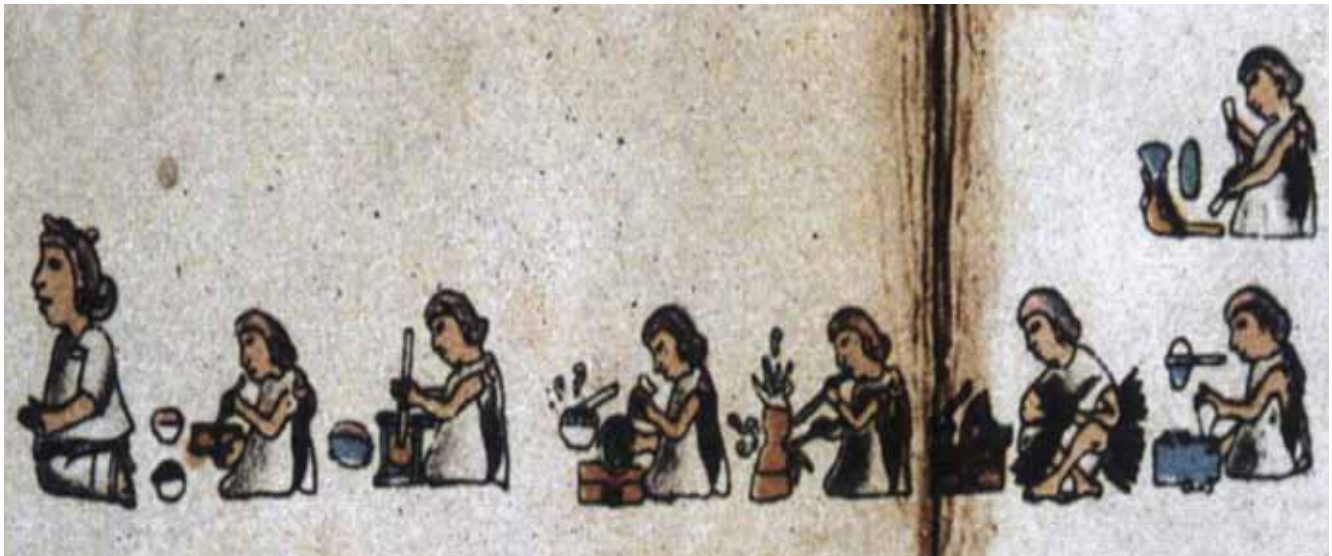
Genealogía de la familia Cano, 1550 • Biblioteca Nacional de Francia.

lujo (como cacao, algodón, turquesas, plumas, pieles de jaguar, oro, textiles y trajes de guerrero con gran variedad de diseños elaborados con plumas y acompañados de sus respectivos escudos militares). También se anotaron productos agrícolas como maíz, frijol, chía, huautli, sal, chile y miel.