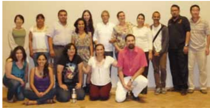
Estudiantes y profesores del Diplomado Teoría y Práctica de la Antropología Social