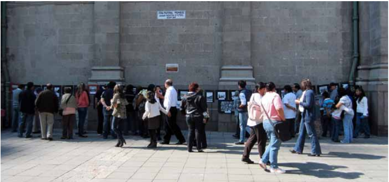
Panorámica de la exposición fotográfica "Nuestro Barrio" ♦ Foto: León Felipe Téllez.

Concluir la parte más intensa del trabajo de campo con esta exposición me ha permitido pensar sobre la necesidad de desempolvar los archivos para llevarlos a las calles, donde adquieren sentido en función de la memoria de quienes le dan vida a un lugar. Sin duda, también deja la puerta abierta para seguir reflexionando sobre las dinámicas que estimulan o limitan la organización colectiva en la ciudad o sobre el papel de los espacios públicos y sus diversos usos. No quedan fuera los pensamientos en torno a los múltiples papeles del antropólogo en campo —investigador organizador— y los alcances de nuestros esfuerzos por construir una confianza mutua —con los actores locales— capaz de movilizar distintas voluntades para alcanzar objetivos específicos —como una exposición o un proyecto a largo plazo—. Allí están plasmados los compromisos personales y profesionales que cada día ponemos en juego, nuestras reticencias a participar en ciertas lógicas o nuestra iniciativa para contribuir en la construcción de una sociedad diferente.