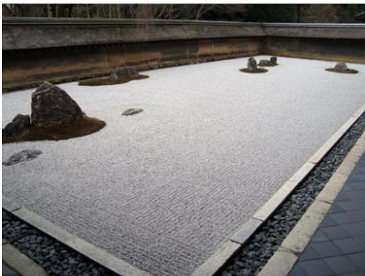
Figura 7: Karesansui, jardín zen, del templo Ryoan-ji (siglo XVI).

El jardín japonés tiene una visión muy compleja del cosmos, la que corresponde a la religión sintoísta, un gran vacío que representa el mar que se llena con diferentes elementos naturales (piedras) que son las islas [5]. El jardín zen más conocido en el mundo es el Karesansui del templo Ryoan-ji (figura 7) del siglo XVI construido en el período Muromachi (1336-1573). La ciudad de Kioto, hoy en un contexto urbano muy contemporáneo y dinámico guarda antiguos valores cuyas raíces están atadas a su fundación. El modelo de la ciudad ideal sigue viviendo. Es posible percibir todo esto visitando el centro de la ciudad, los templos, los jardines y la ribera del río Kamo, saboreando un buen matcha (te verde en polvo).