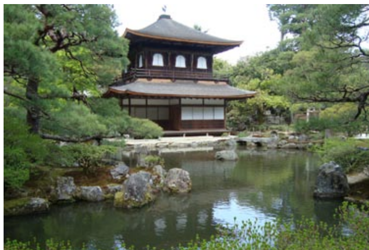
Figura 5: La parte norte de la ciudad de Kioto desde el costado Este con el Templo Ginkaku-ji (1482), Patrimonio de la UNESCO.

Respetando la regla de la ciudad ideal china los mayores templos y santuarios están fuera de este perímetro urbano, sobre las colinas Este y Oeste de Kioto y en la parte norte. Aquí se encuentran dos áreas de templos budistas muy importantes, antiguas villas: el templo Ginkaku-ji al este, conocido también como Pabellón de Plata (figura 5), construcción del 1482 y el templo Kinkaku-ji al Oeste, conocido también como el Pabellón de Oro (figura 6), reconstruido en el 1955. Kioto es conocida también como la ciudad de los mil templos y entre el este y el oeste de la ciudad se encuentran muchísimos templos y santuarios. Principalmente en el exterior del antiguo perímetro urbano de la ciudad los jardines