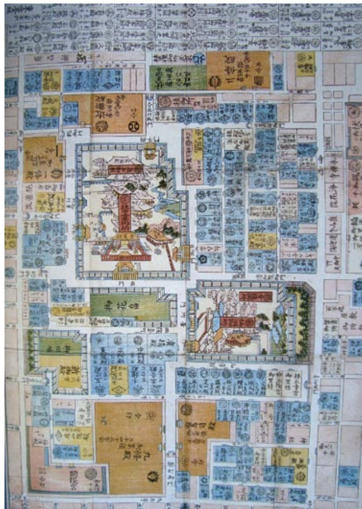
Figura 3: Mapa del Palacio Imperial (1863) (Fuente, AA.VV. Atlas historique de Kyoto, 2008, p. 49).

direcciones principales. Realmente la mayoría de los templos se construyeron a lo largo de las pendientes de las montañas orientales y occidentales y en el interior de la ciudad a lo largo de la dirección norte-sur. El palacio imperial en Kioto se colocó en el Norte al interior de un recinto muy grande, área amurallada, donde estaban también las residencias de los altos nobles (figura 3).