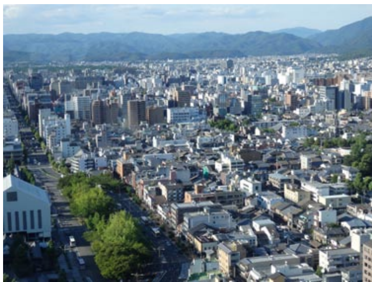
Figura 4: La llanura de la ciudad de Kioto. A la izquierda el templo budista Higashi Honganji, en restauración y la avenida principal (Karasuma dori) con el parque del Palacio Imperial en la parte norte. (Archivo de la autora, 2013).

Después de mil años el modelo ideal de la ciudad china se conserva y se puede leer perfectamente en el mapa actual. Hoy Kioto es la capital de la cultura japonesa, la ciudad sacra donde existe y vive una impresionante acumulación de diferentes expresiones de arte y de arquitectura. Templos budistas, santuarios sintoístas, fortalezas imperiales, jardines zen, casas tradicionales de madera y tierra, construcciones en ladrillo, todos en el interior de un contexto hoy muy contemporáneo con edificios muy altos, futuristas como la nueva y gran estación de ferrocarril, la más importante del centro del Japón y con una interesante aglomeración de áreas protegidas como Patrimonio de la Humanidad de la UNESCO. En esta complejidad cultural Kioto conserva su planeación urbana de tipo ortogonal con las avenidas principales de norte a sur y las calles de este a oeste (figura 4).