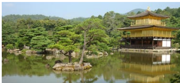
Figura 6: La parte norte de la ciudad de Kioto desde el costado Oeste con el Templo Kinkaku-ji (1955), Patrimonio de la UNESCO (foto de la autora, 2013).