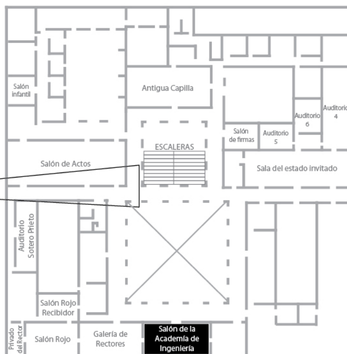
Planta alta del Palacio de Minería