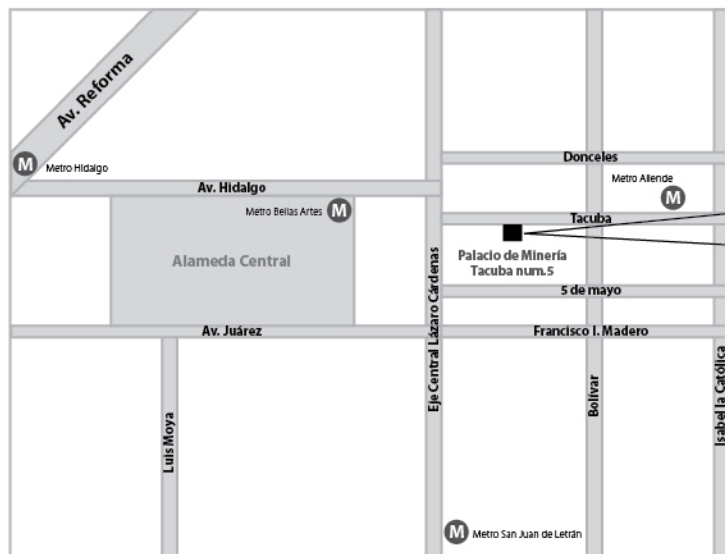
Mapa que muestra las avenidas, calles principales y estaciones del metro cercanas al Palacio de Minería