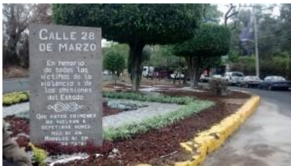
El sexenio de Felipe Calderón (2006-2012)