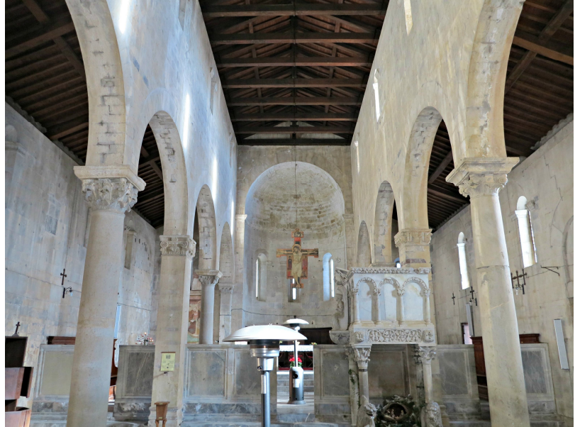
Fig. 5. (izquierda) Interior de la Iglesia de Santa María de Vilamós.