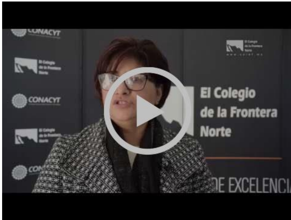
Paridad de género y violencia política | Colef Press