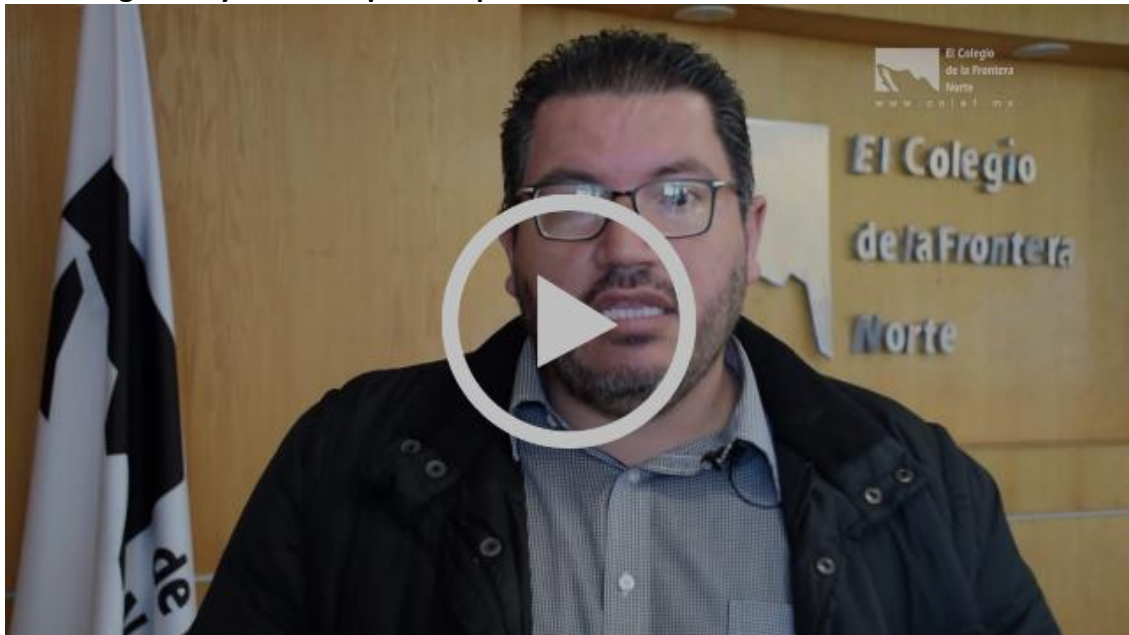
San Quintín. Entre la montaña, el mar y el desierto | Colef Press