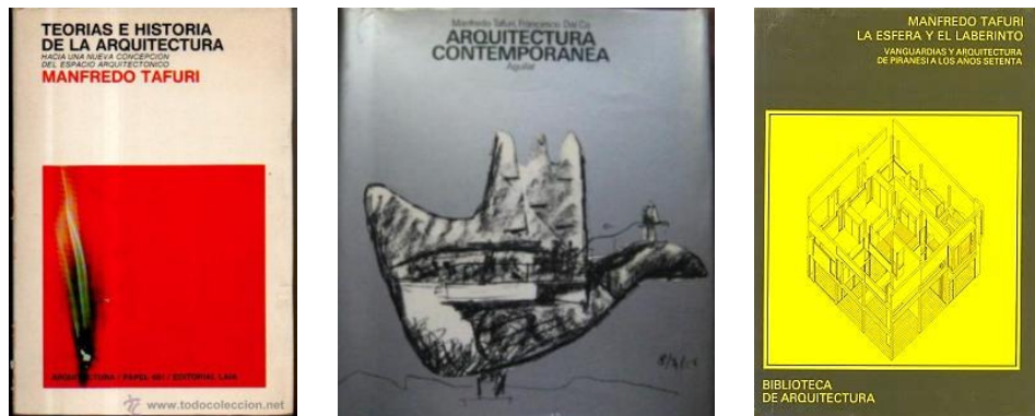
Figura 2: Segundo ejemplo de figura. Portadas de libros de Manfredo Tafuri: Teorías e historia de la arquitectura (1968, izq.), Arquitectura contemporánea (en coautoría con Francesco Dal Co; 1976) y La esfera y el laberinto. Vanguardias y arquitectura de Piranesi a los años setenta (1980, der.).