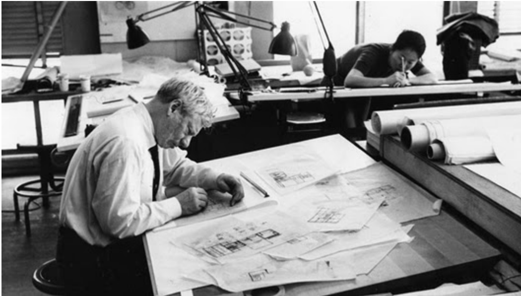
Figura 1: Primer ejemplo de figura. Louis Kahn working on Fisher House design, 1961. © Louis I. Kahn Collection, University of Pennsylvania and the Pennsylvania Historical and Museum Commission. (Fotografía tomada del artículo titulado: “ Even A Brick Wants To Be Something ”- Louis Kahn , por Costas Voyatzis, del 09/06/2013, publicado en revista digital Yatzer ; sin datos del autor de la fotografía).

A continuación se muestran ejemplos de inserción de figuras: