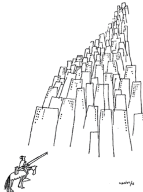
Charge de Claudius em Arquitetura, junho-1963. Veja artigo de Cecilia Ribeiro e Virgínia Pontual em Arquitextos

Noticiário geral Veja todas as notícias disponibilizadas em Vitruvius