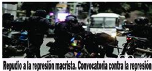
Repudio a la represión macrista. Convocatoria contra la represión