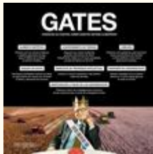
Cómo la Fundación Gates empuja al sistema alimentario en la dirección equivocada