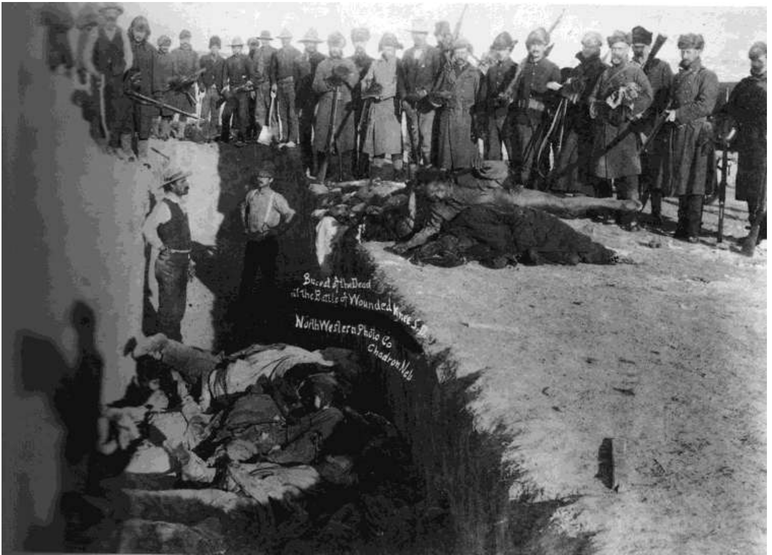
Indígenas norteamericanos masacrados, 1891