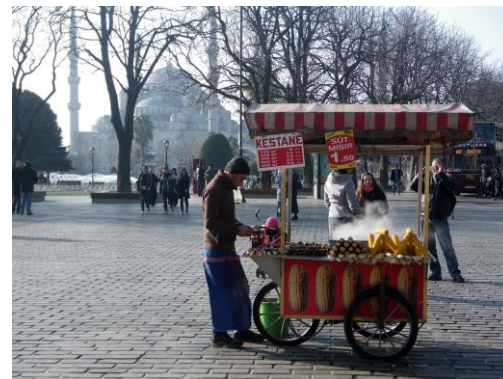
Ambulante de Istambul