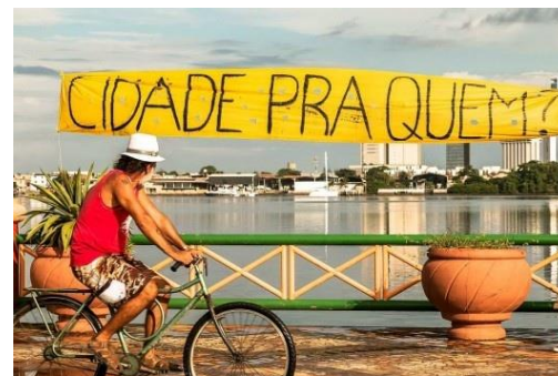
Ocupe Estelita, movimento de resistência popular contra o projeto Novo Recife