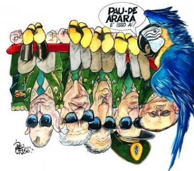
Charge "Pau-de-Arara é isso aí!" Desenho Paulo Caruso