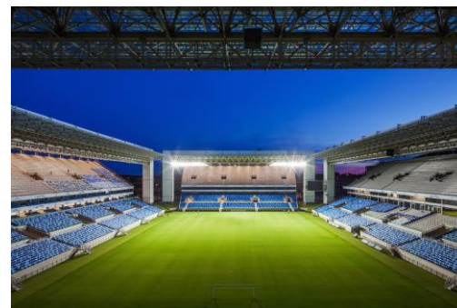
Arena do Pantanal

Arena do Pantanal, GCP Arquitetos / veja também: Armory Art Fair, Rafael Viñoly Architects e outros projetos