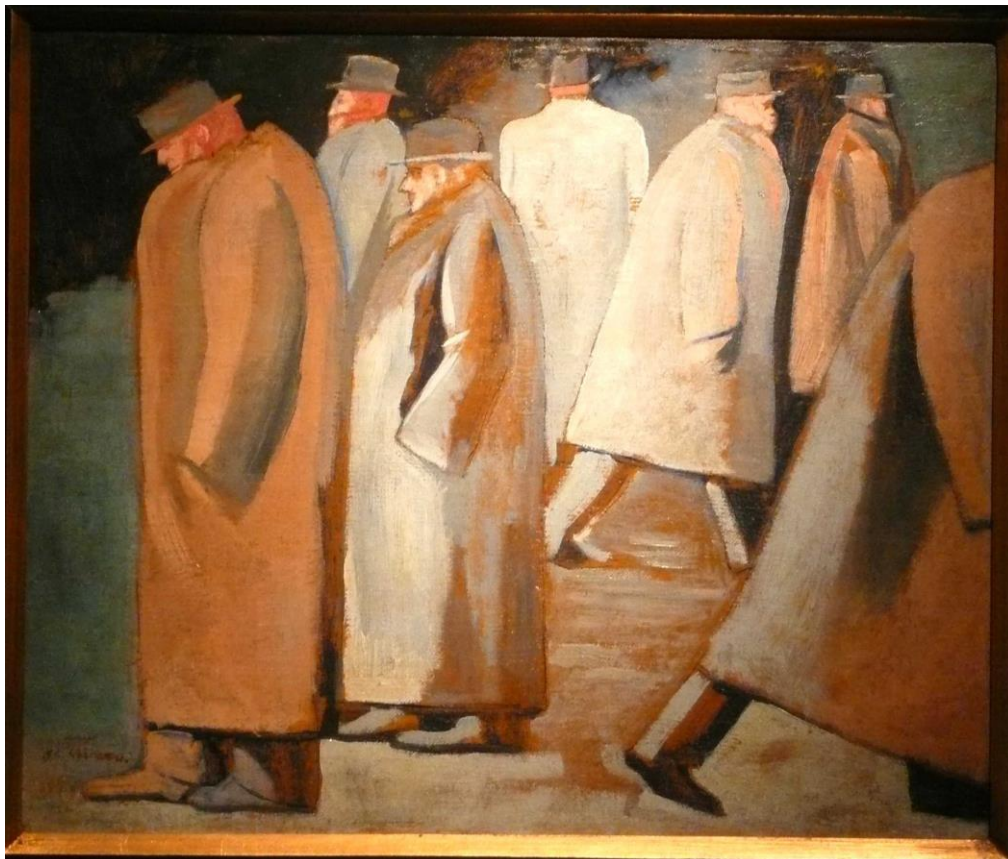
José Clemente Orozco: " El invierno ", 1932.