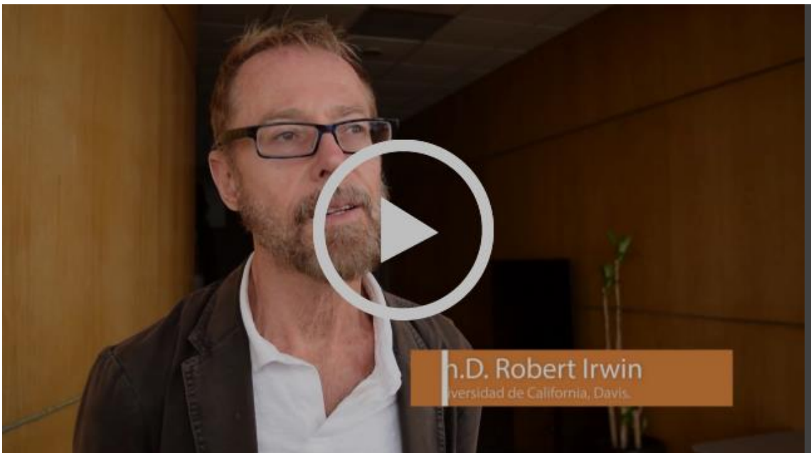
Humanizando la deportación (proyecto de narrativa digital) | UCDavis y El Colef