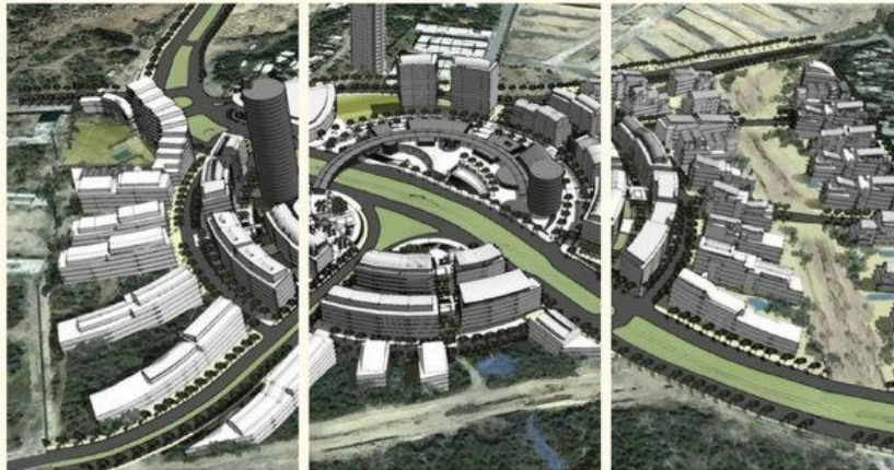
Imagen: Via Cordilera, Valle Poyente, San Pedro Garza García, México, Consultora CEPA