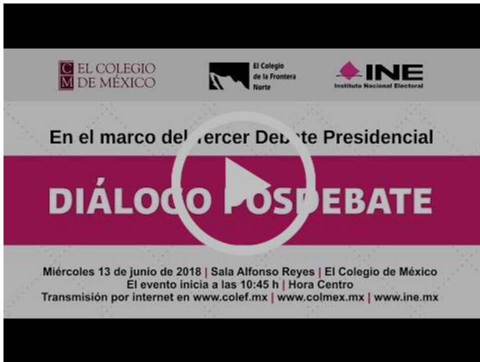
Diálogo posdebate a partir del tercer debate presidencial