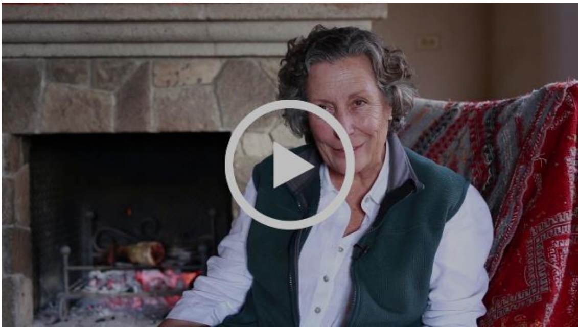
CONVID, Consorcio para el Desarrollo del Sector y las Regiones Vitivinícolas