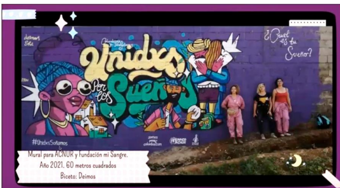
Mural para ACNUR y fundación mi Sangre. Año 2021. 60 metros cuadrados Biceto: Deimos

Necesario el arte urbano feminista para reivindicar el espacio público