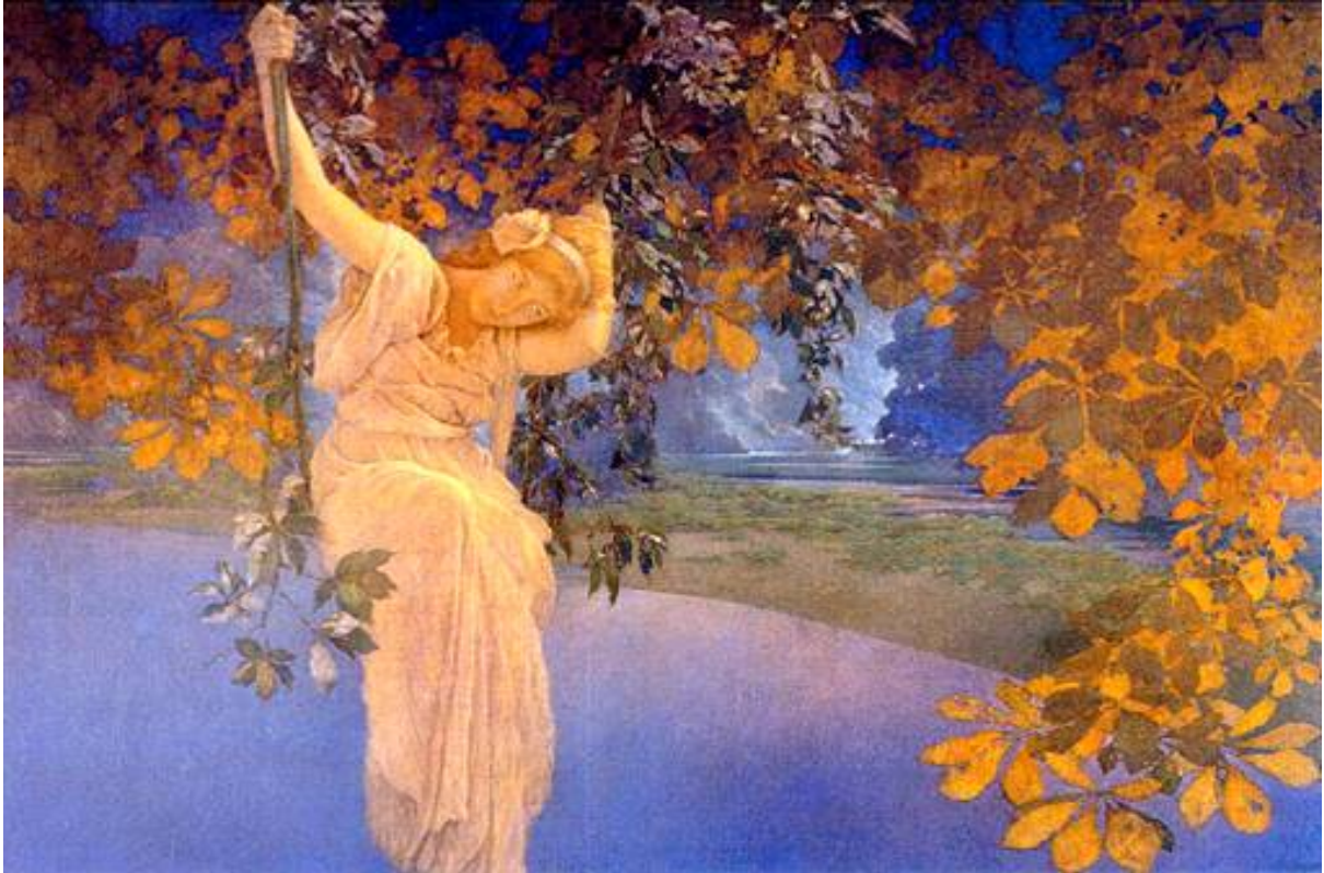
Maxwell Parish, norteamericano: " Sueños o el otoño ", 1913.

JAN: Las primaveras de allá se le aferran a uno a la garganta, las flores brotan a millares por encima de los muros blancos. Si se pasea usted una hora por las colinas que rodean la ciudad, le queda en la ropa el olor a miel de las rosas amarillas.