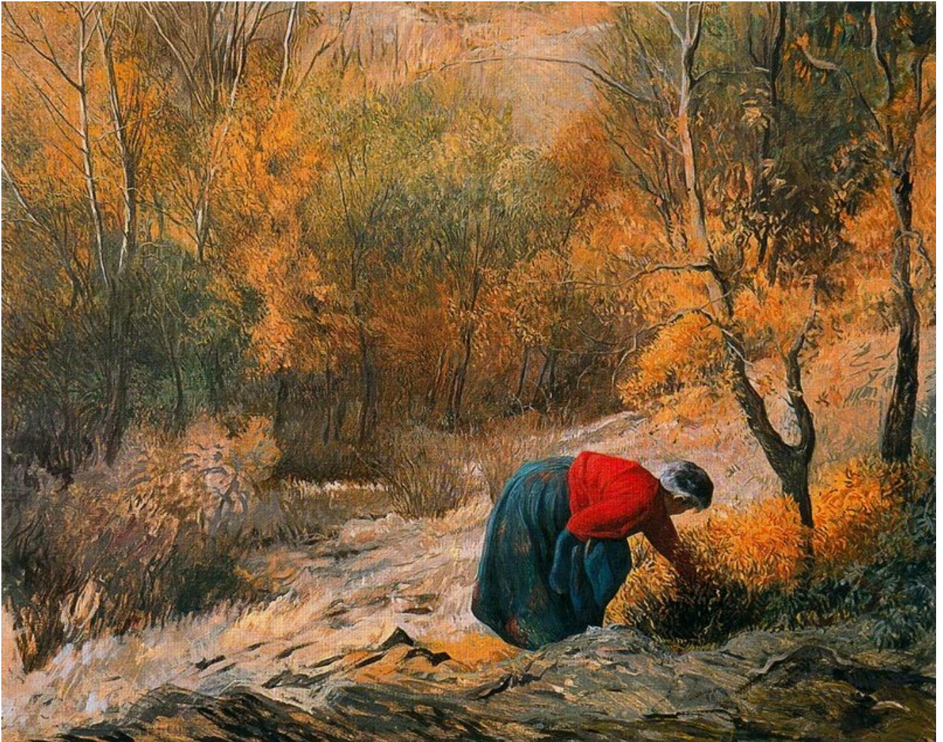
Clara Ganguntia (vasca, contemporánea): " Otoño "