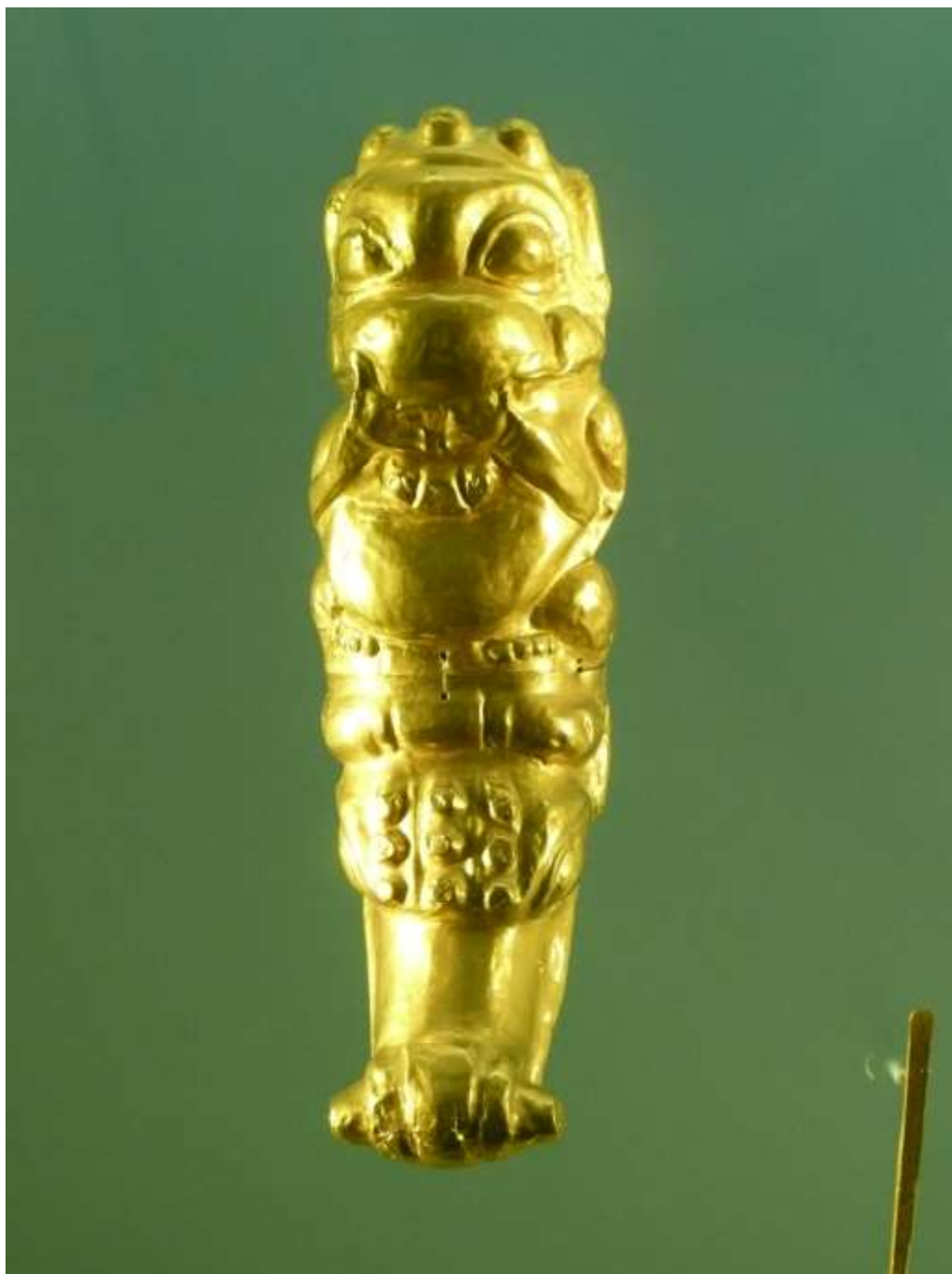
Demonio del pueblo Zenú, Museo del Oro de Colombia