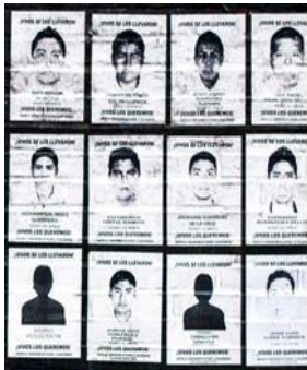
¡Vivos los queremos!