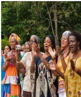
8 de marzo, Día Internacional de la Mujer