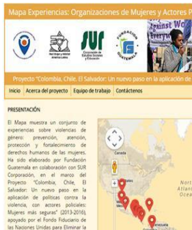
Mapa Experiencias: Organizaciones de Mujeres y Actores Policiales