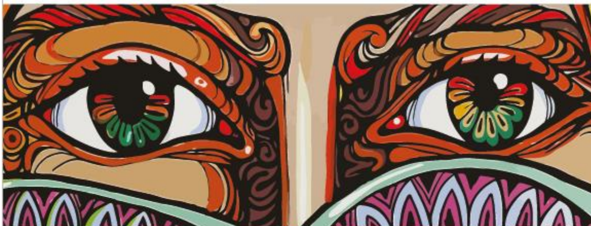
Roberto Calquín / Mural "Tejiendo Futuro" / Doñihue (Chile)