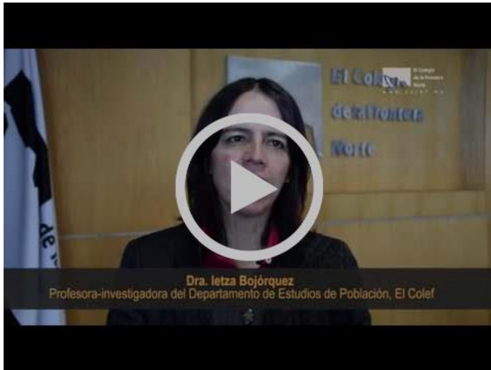
Colef Press | Espacios públicos y actividad física