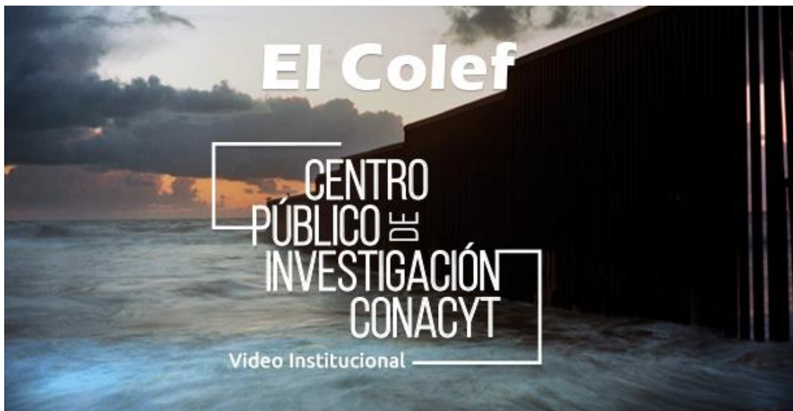
El Colef - Video Institucional 2019