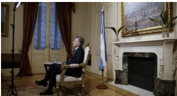
La enigmática supervivencia política de Mauricio Macri