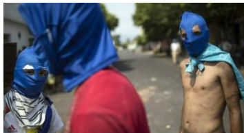
Venezuela: la guerra no solo es de minitecas