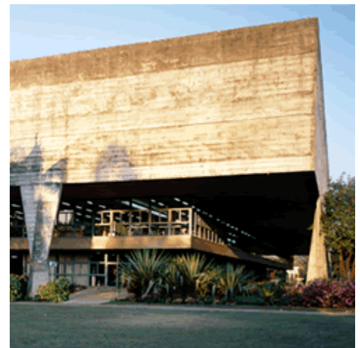
Faculdade de Arquitetura e Urbanismo da Universidade de São Paulo – FAU-USP, São Paulo. Arquitetos Vilanova Artigas e Carlos Cascardi. Veja artigo de Pedro Engel em Arquitectos