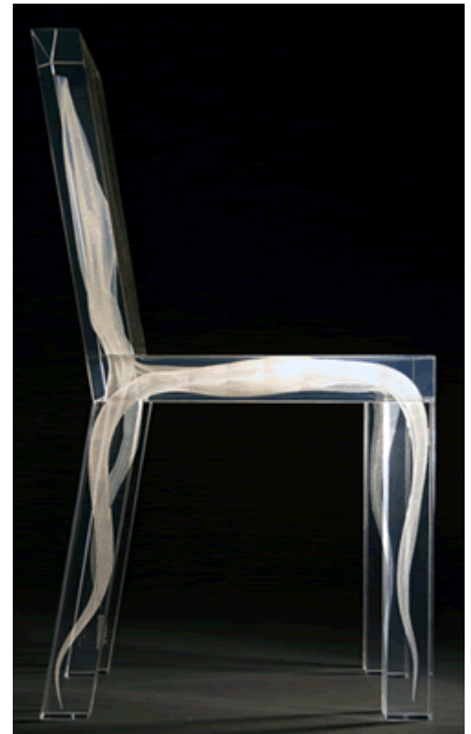
Cadeira Ghost 2. Coleção Ghost por Drift, design de Ralph Nauta e Lonneke Gordijn. Veja artigo de Giovanna Del Brenna em Drops

Pesquisa da Unicamp Inovação no levantamento do valor desejado na