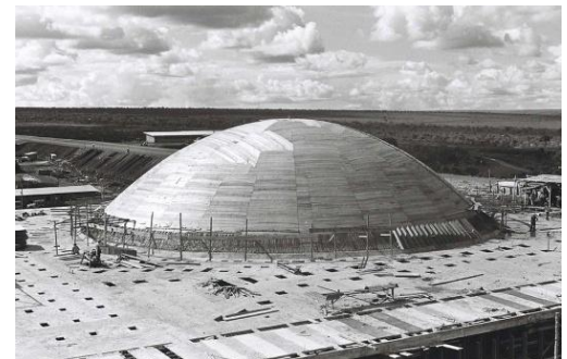
Fôrma da cúpula do Senado em Brasília. Leia artigo de Danilo Matos Macedo e Elcio Gomes da Silva em Arquitectos