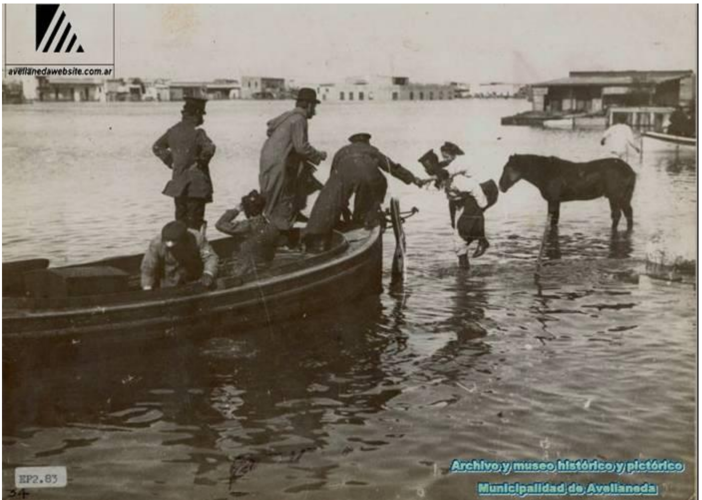
Inundación de 1911