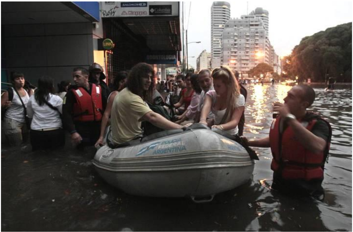
Inundación de 2010