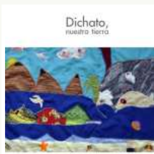
Dichato, nuestra tierra