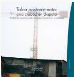
Talca posterremoto: una ciudad en disputa Modelo de reconstrucción, mercado inmobiliario y ciudadanía