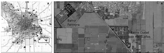
GRÁFICO /vivienda Social - Recorte Fracciones 53 y79