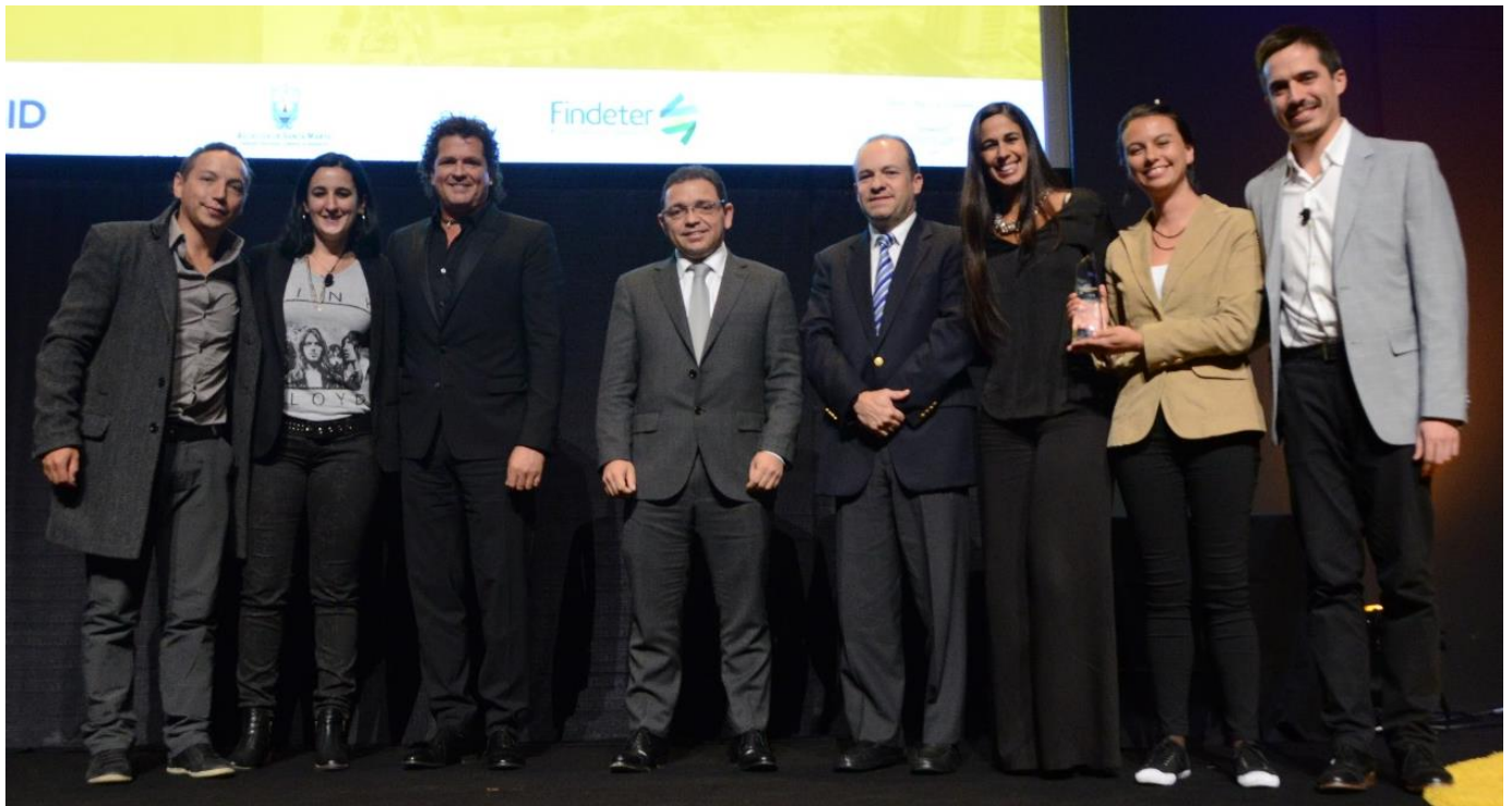
Equipo ganador del concurso BID UrbanLab Santa Marta 2016 junto a miembros del Comité Organizador.

De entre todos los equipos participantes en el concurso, el jurado elegirá tres equipos finalistas . Un integrante de cada equipo finalista, junto con el docente supervisor, tendrán la oportunidad de presentar su proyecto final ante el panel de jurados del concurso y expertos internacionales en la ciudad de Mendoza, Argentina en marzo de 2018 invitados por el Comité Organizador BID UrbanLab. Posterior a la presentación se realizará la ceremonia de premiación.