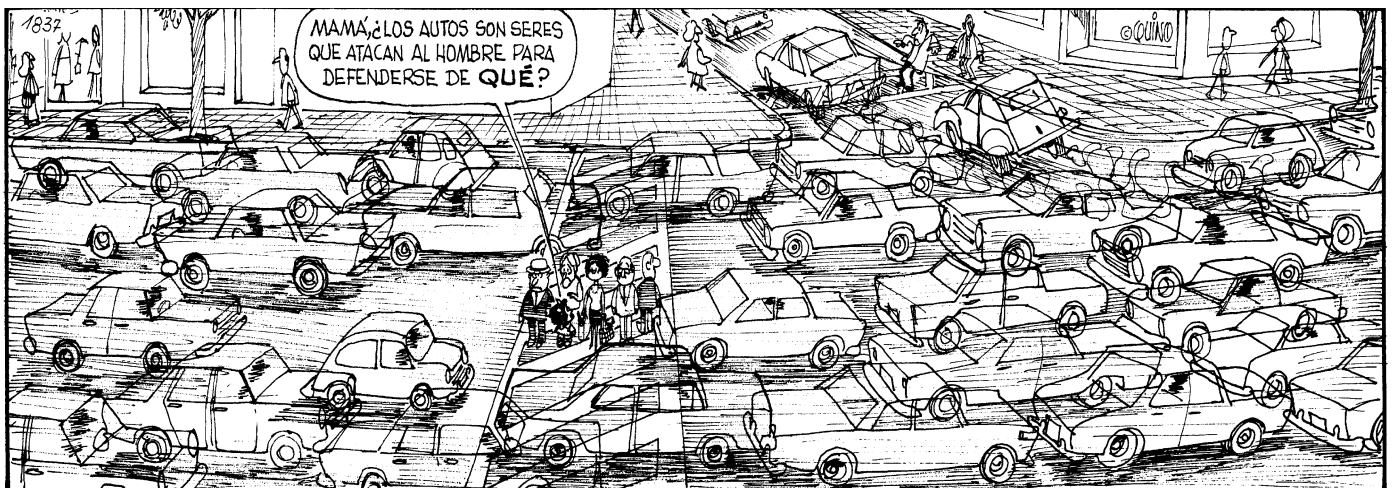
© Joaquín S. Lavado, QUINO. Toda Mafalda, Ediciones de La Flor.

Luego de seleccionar el proyecto ganador del BID UrbanLab, 3 miembros del equipo ganador tendrán la oportunidad de trabajar por un tiempo determinado, entre abril y mayo de 2018 , en la ciudad de Mendoza, Argentina, para validar y adaptar su proyecto urbano de la mano con técnicos locales, aliados, especialistas del BID, la comunidad y otros actores relevantes.