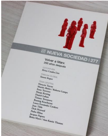
Volver a Marx 200 años después