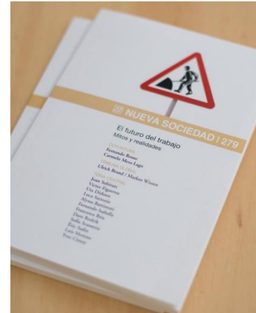
El futuro del trabajo Mitos y realidades